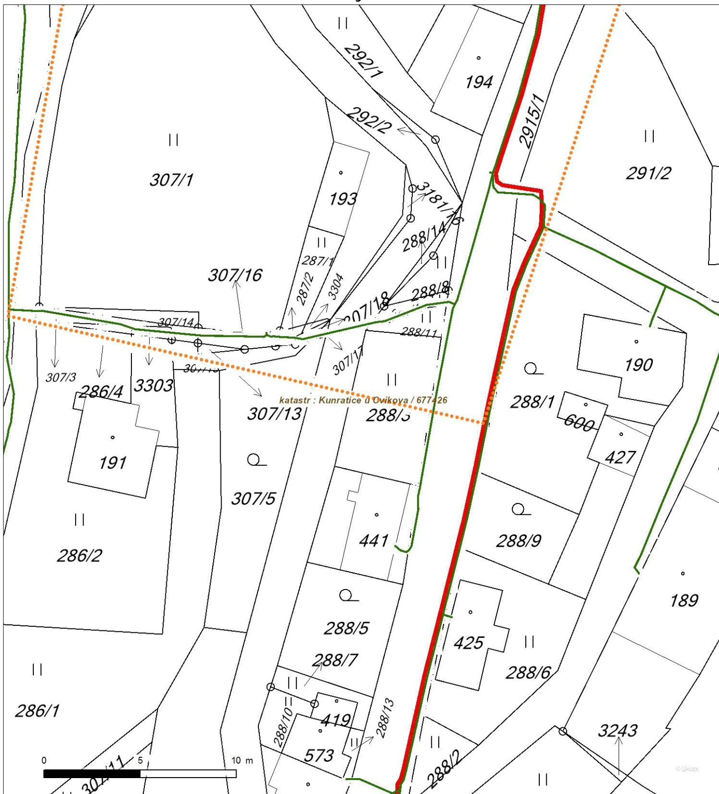
Situa ní výkres - list 2

Není-li zobrazena katastrální mapa, zadejte žádost znovu. Katastrální mapa je generována prostřednictvím externí WMS služby, jejíž provoz nezajišťuje společnost EZ Distribuce, a. s.